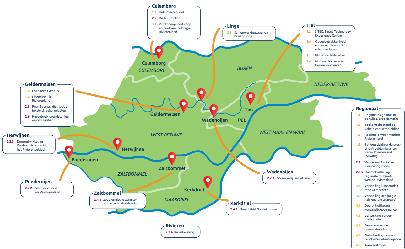
Figuur 1: verspreiding van de Regio Deal projecten binnen Regio Rivierenland

We zijn trots om te laten zien dat de beoogde programmaresultaten bijna allemaal gehaald zijn. Onze regio is sterker geworden dankzij de Regio Deal.